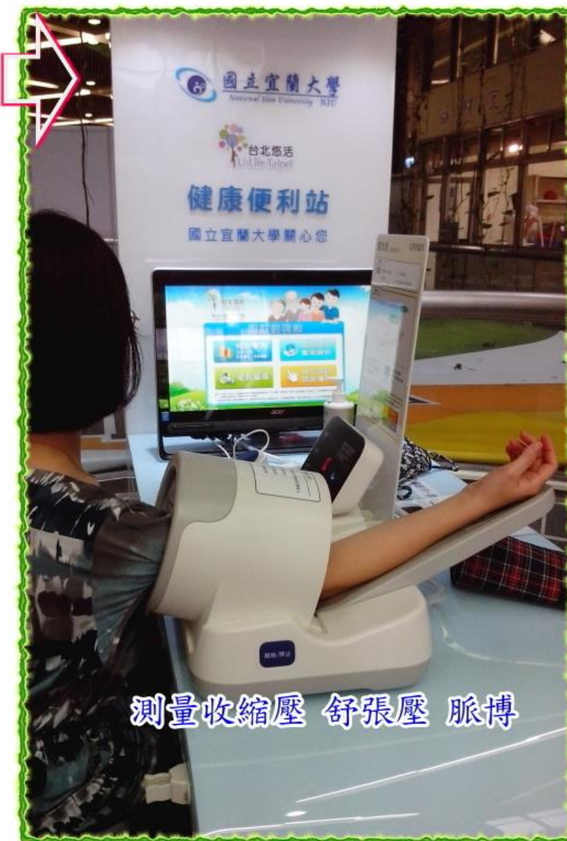
測量收縮壓 舒張壓 脈博