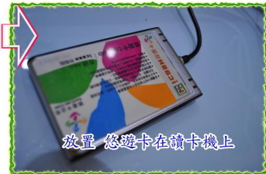
放置 悠遊卡在讀卡機上