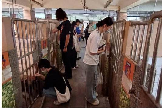
同學們觀察觸摸成犬