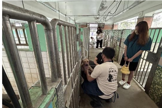
同學近距離觀察並向志工提問