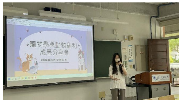
分組上台分享參訪心得