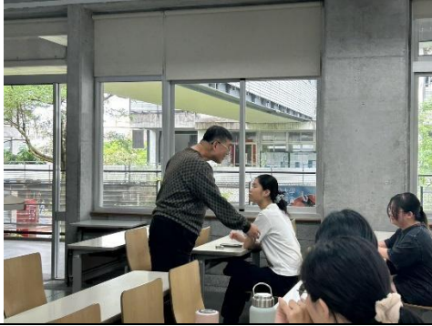
行前在課堂討論需觀察之重點