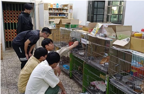
同學們觀察觸摸幼貓幼狗