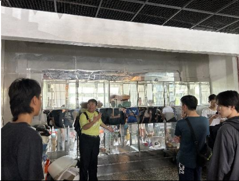
老師講解觀察細節與相關知識