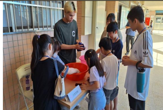
服務學習科學營:浮墨實驗