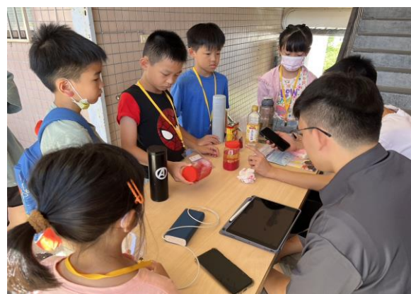
服務學習科學營:熔岩塔