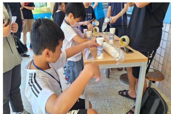
服務學習科學營:飛行杯