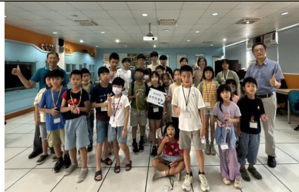
服務學習:科學營大合照