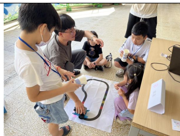
服務學習科學營:自走車