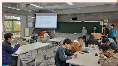
業師出席成果發表會並擔任評審