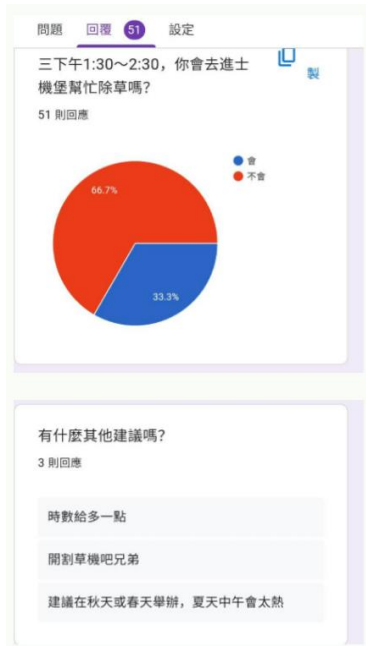
學生設計關於進士機堡的問卷