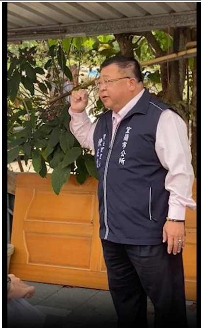
里長親自介紹鑑湖堂與周邊景點