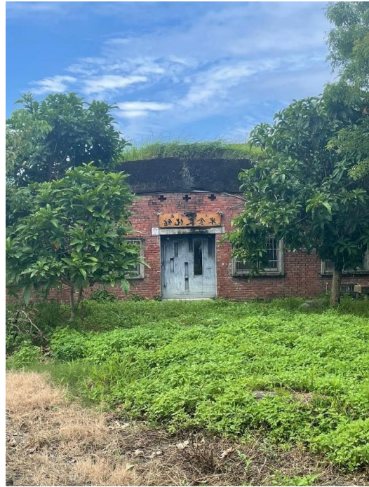
宜蘭進士機堡 學生拍攝機堡正面