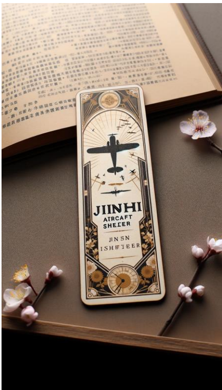
學生製作的進士機堡書籤