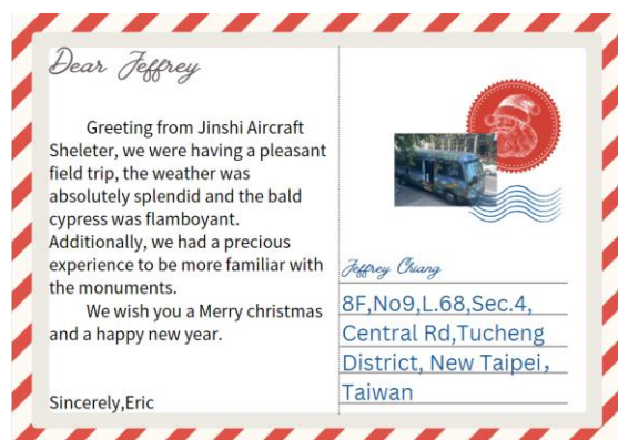
學生的 Story Mapy 作品 明信片