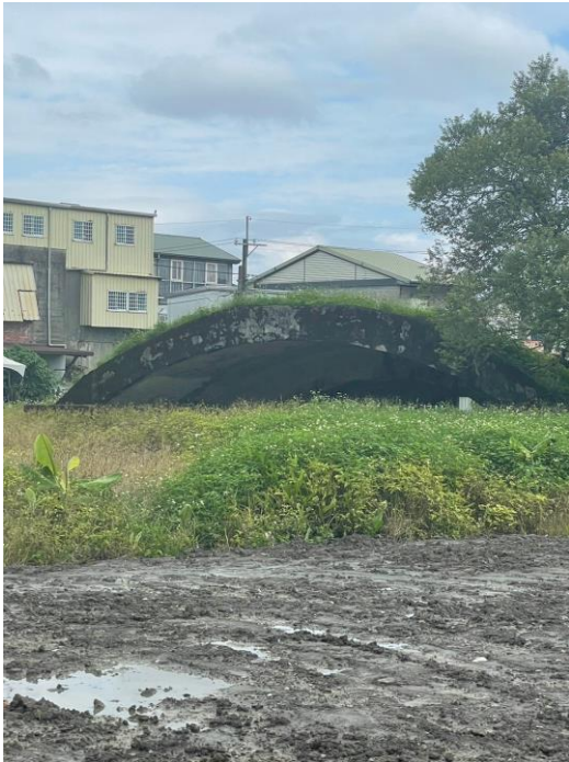
宜蘭進士機堡 學生拍攝機堡後面