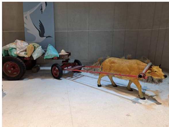
狀園沙丘服務區參訪