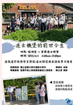
進士機堡 課程活動