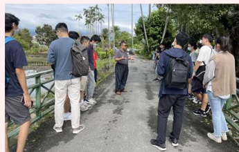
里長介紹鑑湖堂的文化與地理環境