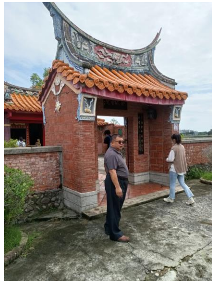
登瀛書院 學生參觀