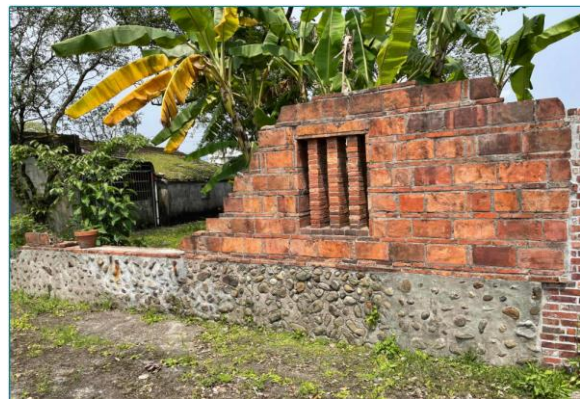
二戰後留下來的其中一個鑑湖堂的遺跡