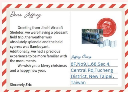
學生的Story Map作品 進士機堡主題明信片

藉由每一次實地走訪那些景點與活動，讓同學們更能了解宜蘭周遭的在地文化與歷史建築，也訓練同學使用英文來試著介紹這次活動所造訪景點的特色，激發同學們去思考宜蘭的特色與文化。搭配每一次的學習單與期末的Story Map，讓同學去學習團隊合作，也讓同學練習去發掘進士機堡所面臨的狀況，並且試著提出解決方法，除了了解到當地的特色與文化，也訓練同學解決問題的能力。