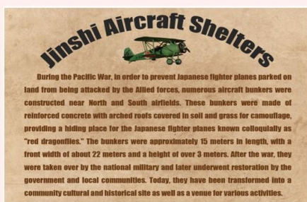
學生的Story Map作品 進士機堡介紹卡片